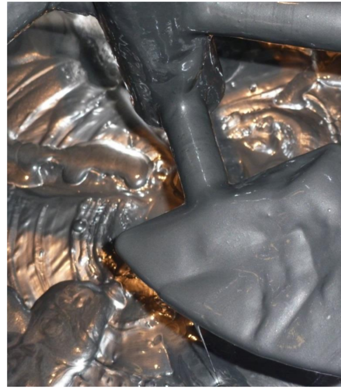
Inhomogene Elektrodenpaste [1]