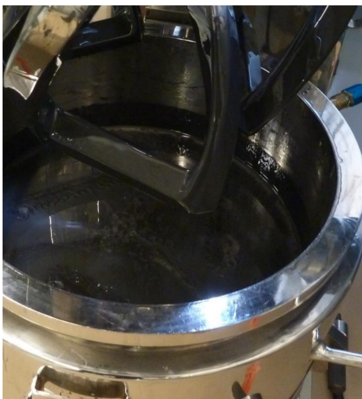
Homogene Elektrodenpaste [1]