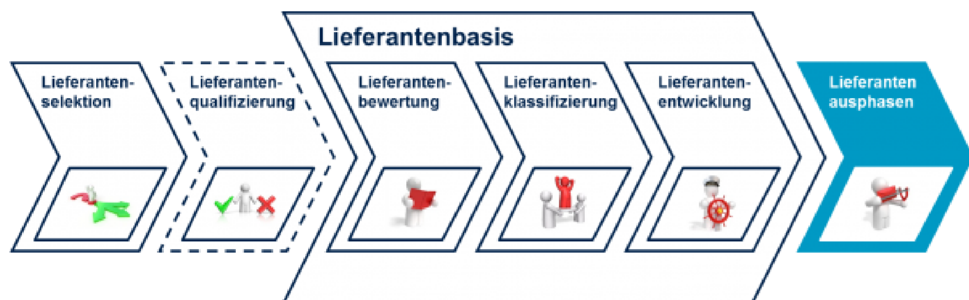
Abb. 1: Prozess des Lieferantenmanagements [www.lieferanten-management.com]