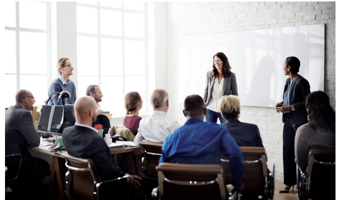
Weiterbildungsseminare helfen Managern, technische Veränderungen und kulturellen Wandel im Unternehmen in Einklang zu bringen.

WINGS, der Fernstudienanbieter der Hochschule Wismar, hat auf diesen Bedarf reagiert und empfiehlt die Weiterbildungen „Change Management“ und „Personalpsychologie“. Die Kurse richten sich an Manager, die ihre Kompetenzen für die erfolgreiche Integration ihrer Mitarbeiter in Veränderungsprozessen ausbauen wollen.